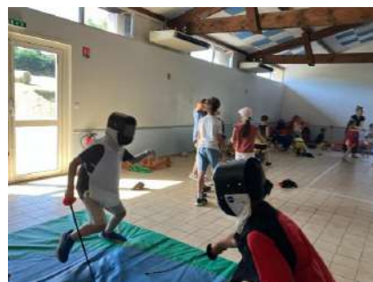
Kermesse des écoles...

Cette année, nous soutiendrons financièrement l'école de Saint-Georges qui organise une classe verte au Temple-sur-Lot.