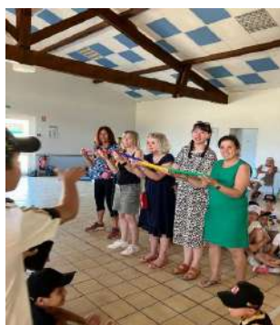
...tout le monde s'amuse !

Vous pourrez nous retrouver le 15 Mars prochain à l'occasion des élections municipales devant les Mairies de Saint-Georges et de Bourlens, nous vendrons des gâteaux « faits maison » ainsi que des boissons.